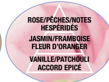
FLEUR DE LIN