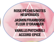
FLEUR DE LIN