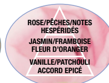
FLEUR DE LIN