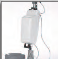
Réservoir de solution (14 L)