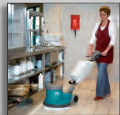
Machine en action