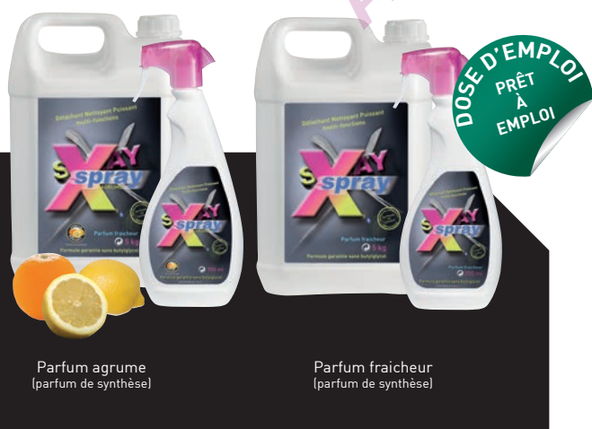
Parfum agrume (parfum de synthèse)