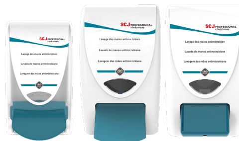
ANT1LDSSTH* ANT2LDPSTH ABL2LDPSTH