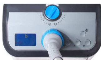
Ecran de contrôle