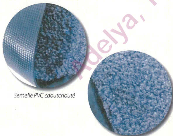
Semelle PVC caoutchouté