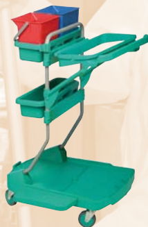
CHARIOT LIVRE SANS PRESSE, SANS SAC ET SANS COUVERCLE KIT PORTE SAC (à commander séparément)