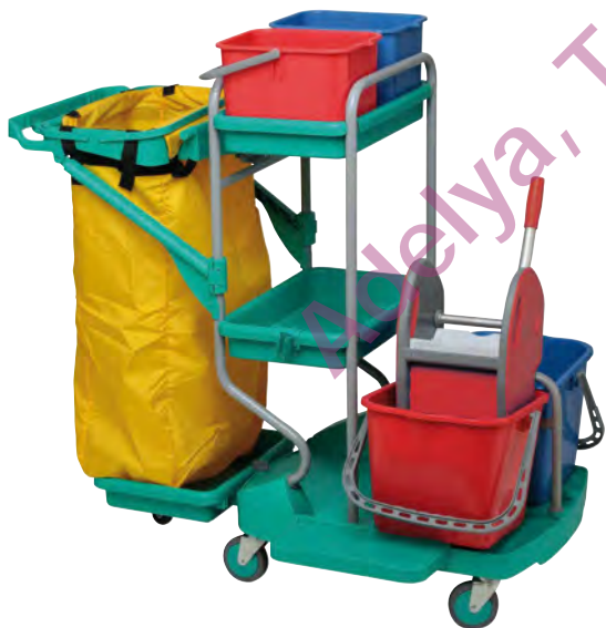
Chariot livré sans presse et sans sac.

Adapté aux espaces réduits Pratique et maniable Stable (5 roues)