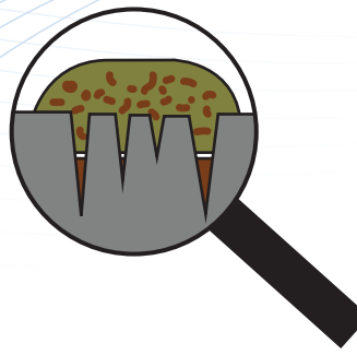
Mouillage avec produits de nettoyage traditionnels