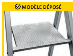
PLATE-FORME DE TRAVAIL ANTIDÉRAPANTE en fonte d'aluminium. Dimensions 250 X 250 mm.

Articulation haute résistance en fonte d'aluminium qui enveloppent le profil arrière.