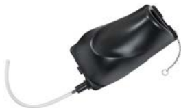
Kit réservoir Code 412024