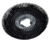
Brosse moquette Code 412022

Moteur asynchrone puissant avec démarrage en douceur et transmission par courroie