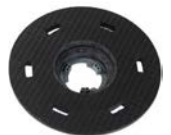
Plateau support disque Code 412025