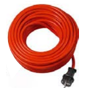
Câble d'alimentation Code 412026