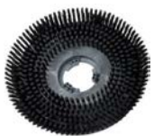
Brosse standard Code 412023

Livrés avec la monobrosse, commande possible si besoin de les remplacer.