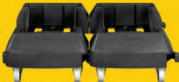
Socle clipsable en résine