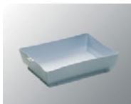
Bac de pré-impregnation

Performant : imprégnation homogène des franges grâce à ses 256 trous en forme d'entonnoirs qui permettent une répartition équilibrée du liquide.