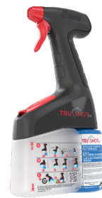
Compatible avec le pulvérisateur TruShot 2.0®