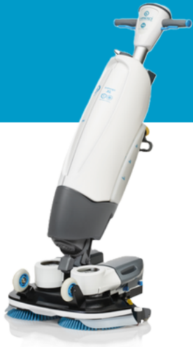
K.1.IMOPXLU.FCT.0C i-mop XL PRO V23 • sans batterie • sans chargeur