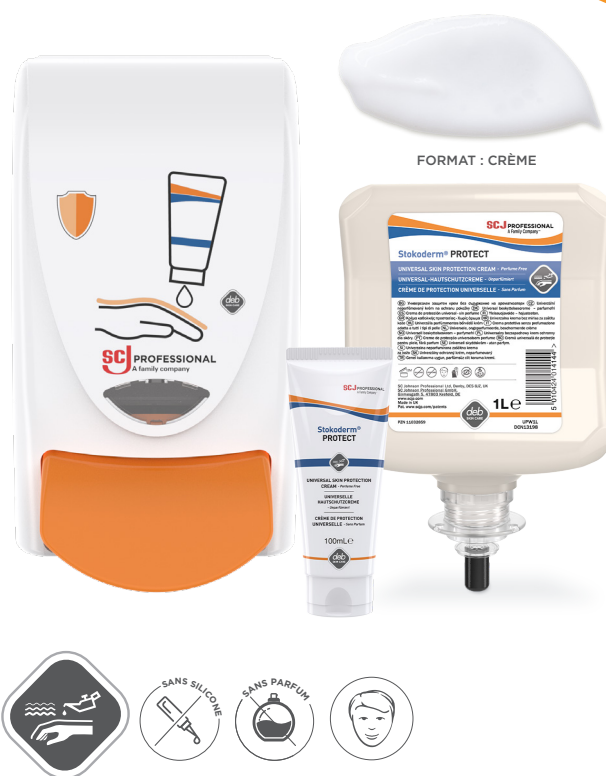
FORMAT : CRÈME