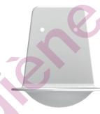
Coupelle stop gouttes (AC0170)