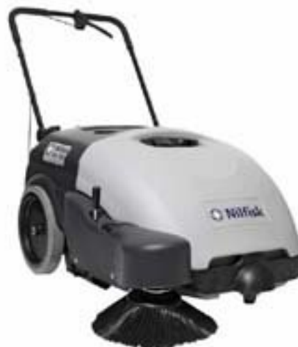
L'image affichée peut ne pas représenter le modèle proposé