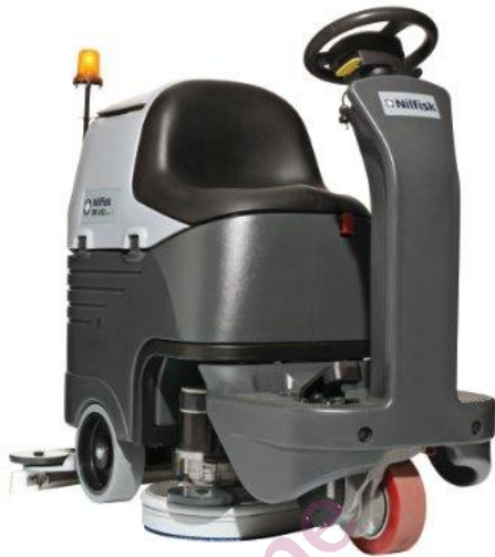
L'image affichée peut ne pas représenter le modèle proposé

Les autolaveuses de la série des BR 652/752 sont extrêmement polyvalentes, destinées aux applications légères à difficiles pour le nettoyage des larges surfaces où un nettoyage de qualité est demandé. Leur extrême compacité leur garantit un accès facile aux zones les plus encombrées. Le faible niveau sonore les rend idéales pour le nettoyage des zones sensibles aux bruits ou pour le travail de jour. La série des autolaveuses BR652/752 avec leur bloc de lavage breveté offrent un très faible niveau sonore, un design compact et ergonomique permettant à ces machines de nettoyer à peu près partout. Elles bénéficient également du système Ecoflex qui permet un contrôle de la consommation d'eau, de détergent et d'énergie si efficacement que l'on peut réaliser de véritables économies sans compromettre la performance !