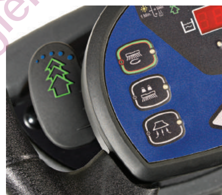
Une palette permet d'activer et de désactiver le système Ecoflex