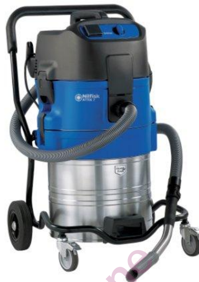
L'image affichée peut ne pas représenter le modèle proposé