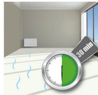
Protection des sols en linoléum exposés à l'humidité.