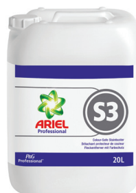
ARIEL PROFESSIONAL S3 DÉTACHANT PROTECTEUR DE COULEUR