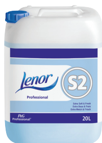
LENOR PROFESSIONAL S2 ADOUCISSANT